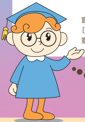
ヒューマン博士 (福岡県の人権啓発キャラクター)

宣誓書受領証カードは、県営住宅の入居申込など、本県の行政サービスに利用できます。 [事業者のみなさまへ] 宣誓書受領証カードの提示を受けられた方は、この制度の趣旨をご理解いただきますようお願いいたします。