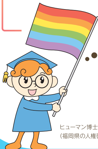
ヒューマン博士 (福岡県の人権啓発キャラクター)

(※)三重県男女共同参画センター、日高庸晴 宝塚大教授による共同研究 高校生一人アンケート(2017)、電通ダイバーシティラボ(2018)、大阪市民の働き方と暮らしの多様性と共生に関するアンケート(2019)